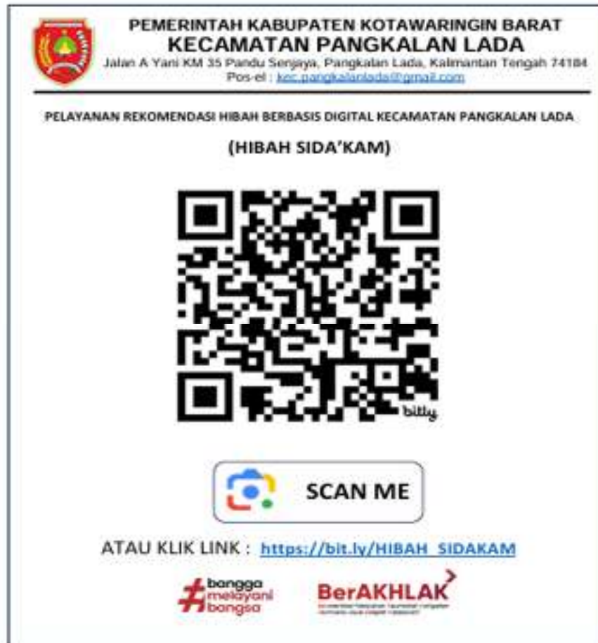
Gambar 2.1 Inovasi Pelayanan Rekomendasi Hibah Berbasis Digital Kecamatan Pangkalan Lada “HIBAH SIDA’KAM”