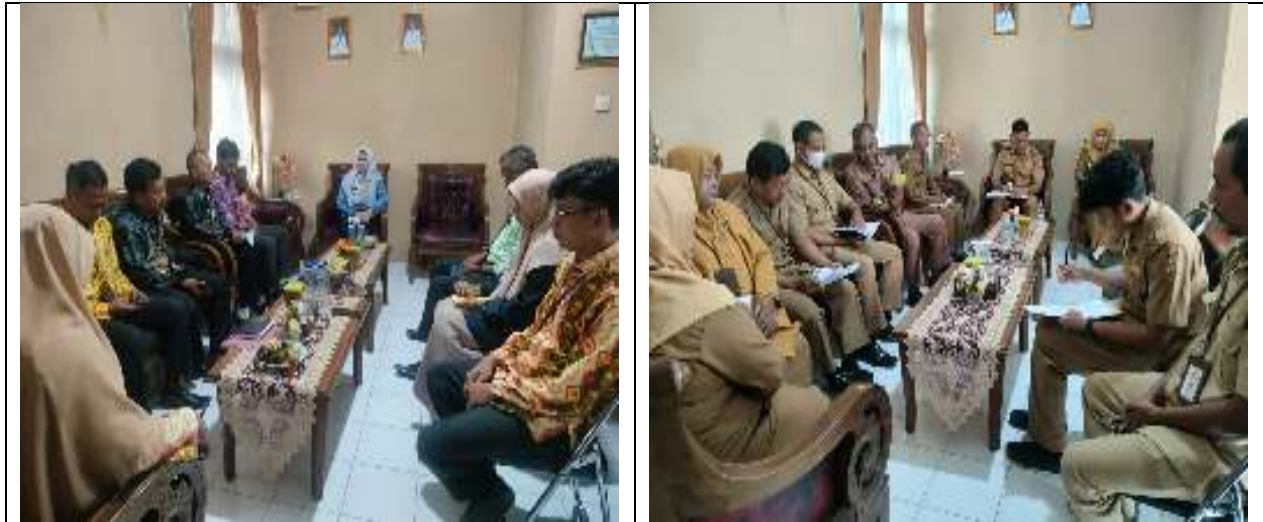
Rapat Bulanan Evaluasi Kegiatan