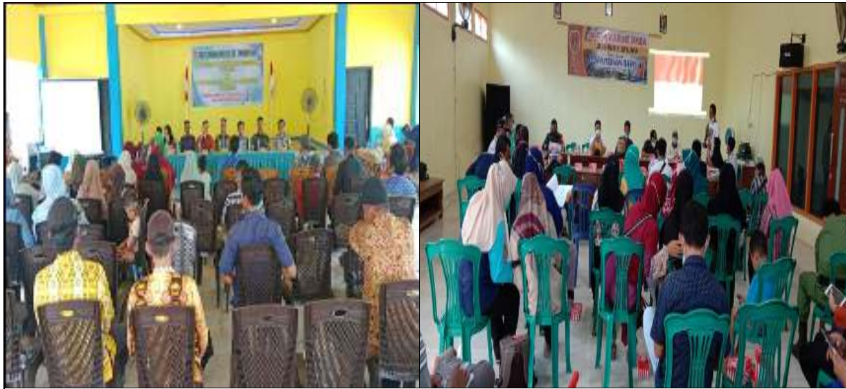
Kegiatan Pendampingan Musdes Desa