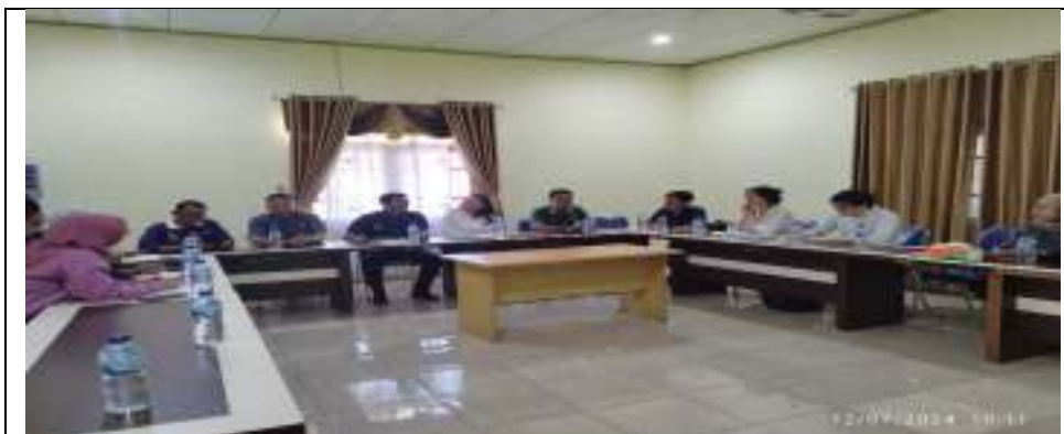
Pendampingan Kunjungan dari Kedubes Inggris ke desa Lada Mandala Jaya