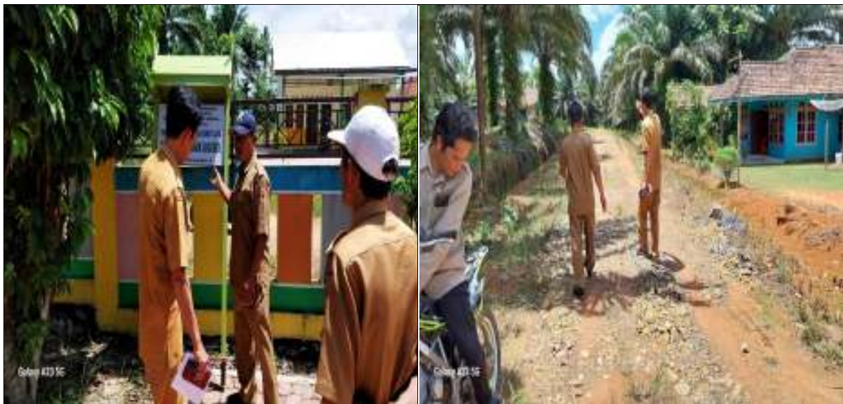
Kegiatan Monev Desa