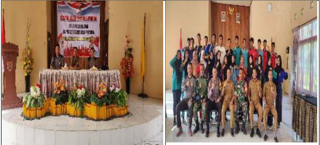
Pelatihan Pemuda dan Karang Taruna se Kecamatan Pangkalan Lada