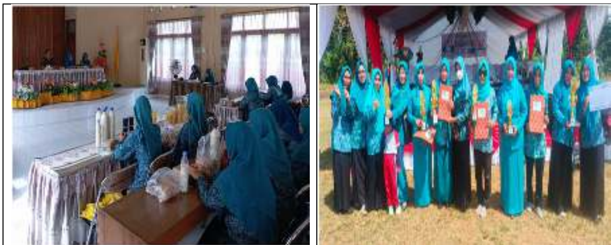
Kegiatan PKK Kecamatan Pangkalan Lada