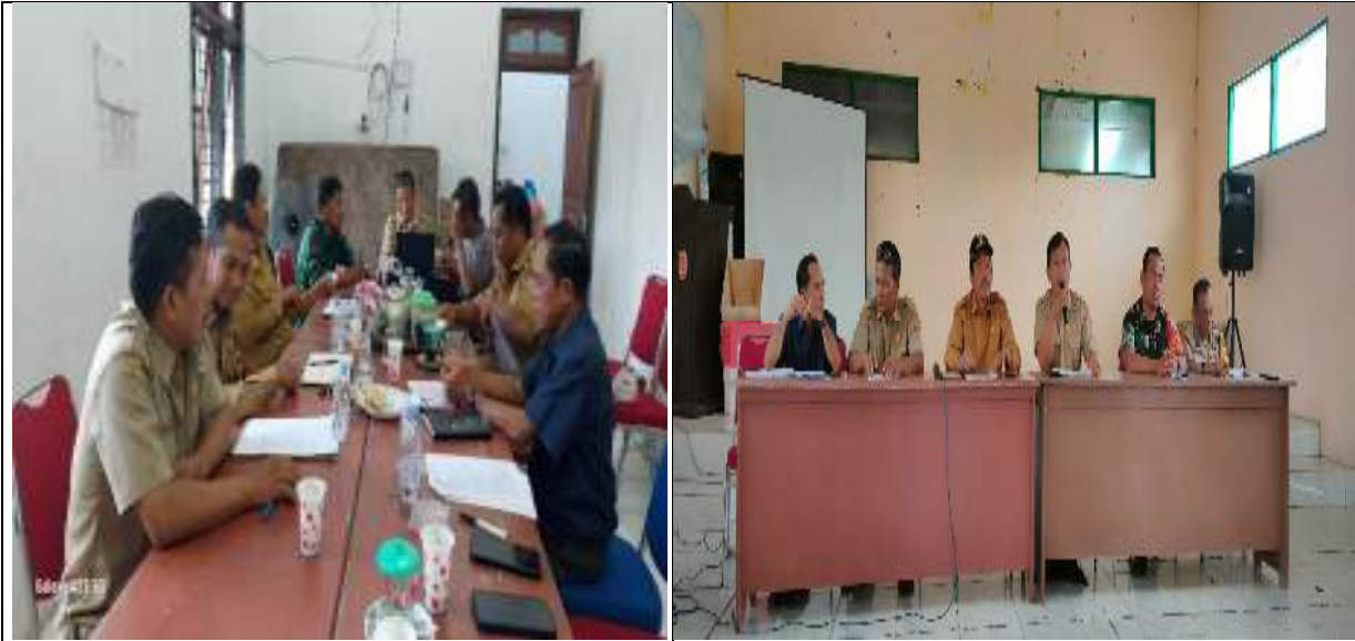
Kegiatan Pendampingan Desa