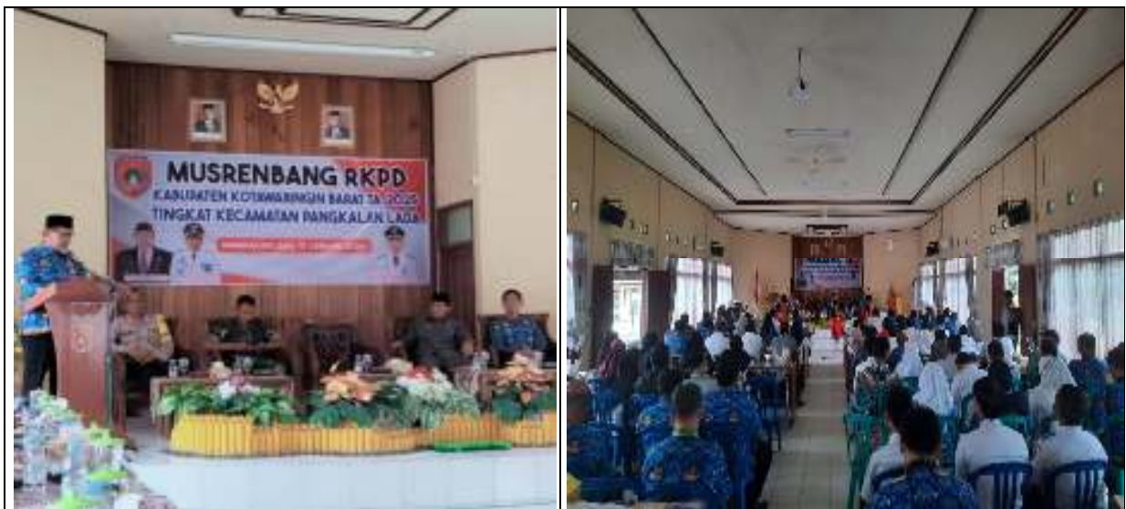
Kegiatan Murenbang RKPD Kecamatan